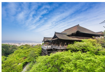
世界文化遺產 清水寺