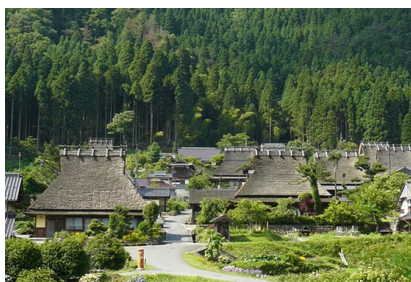
日本原風景美山合掌造

◆【美山合掌村】與岐阜縣白川鄉・(富山縣)五箇山的合掌村、福島縣的大內宿為日3大現存的茅葺屋集落。目前約有50戶建築，其中共有38棟茅葺屋(32棟為住宅、6棟為民俗資料館、店鋪)。於平成5年(西元1993年)被選為國家重要傳統建造物群保存地區。因為與白川鄉相比，對一般旅客而言此處較為隱密，彷彿遺世獨立的村落氛圍更能突顯古樸建築特色，機能性造型設計如今也成為觀光留影的罕有趣味。◆【清水寺】為京都最古老的寺院，建於公元798年，占地面積13萬平方米，相傳由唐僧在日的第一個弟子慈恩大師創建。現存清水寺為1633年重修。不論春季的櫻花，秋季的楓景都十分誘人，大殿前為懸空的「清水舞台」，由139根高數十米的大圓木支撐縱橫交錯取得支撐力，寺院建築氣勢宏偉，結構巧妙，未用一根釘子，為日本最大的木造建築。大殿所供奉面十一面千手觀音平常無法見到，33年才公開一次。PS：預計2017年春天清水寺寺廟進行整修，完工日期至2020年奧運開幕前；此期間景觀稍有影響，如造成不便之處，敬請見諒！◆【地主神社】位於清水寺正殿北側，神社內良緣之神極受年輕人的喜歡，在這裡終日可見祈求良緣的年輕女性虔誠參拜，熱鬧非凡。據說舉凡從舞台及姻緣石走過一遭者，除可健康長壽外更可締結良緣。◆【音羽瀑布】清水寺正殿旁有一山泉，稱為《音羽瀑布》，流水清冽，終年不斷，被列為《日本十大名水》之首，清水寺愛此而得名。◆【祇園】是京都繁華區的代表地段，以觀賞舞妓或藝妓舞藝的「花街」聞名。「祇園」位於八坂神社前，以四條通為主要街道，自鴨川開始到東大路通及八坂神社，沿路可見御茶屋、日本料理店及酒吧，也有著名歌舞伎劇場「南座」。走在兩側裝設格子戶的古老木造建築巷道中，可體驗到古都昔時的風雅情調。由北部的新橋通至白川沿路的地區，被指定為「重要傳統建造物群保存地區」，南部包括花見小路的地區受京都市指定為「歷史景觀保全修景地區」，這兩個地區皆受政府保護，成為京都文化、觀光的名勝。◆【八坂神社】平安建都前作為創際儀式的全國祇園社總社，對於驅邪、去病、生意興隆等的祈願據說非常靈驗，位於在四條大通盡頭塗滿朱紅的西樓門非常顯眼，此地也是京都三大祭典之一的祇園祭的重要據點。周邊祇園地區巷弄縱貫，一間間門面精巧各具特色的茶屋、料理店比鄰而立，自古便是全日本憧憬的獨特夜生活風情。