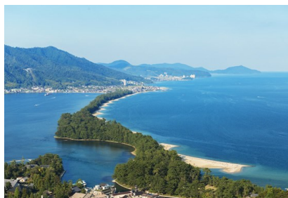
日本三大景-天橋立