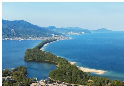
日本三大景-天橋立