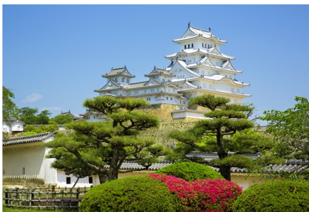
世界文化遺產 姫路城

【美山合掌村】與岐阜縣白川鄉・(富山縣)五箇山的合掌村、福島縣的大內宿為日3大現存的茅葺屋集落。目前約有50戶建築,其中共有38棟茅葺屋(32棟為住宅、6棟為民俗資料館、店鋪)。於平成5年(西元1993年)被選為國家重要傳統建造物群保存地區。因為與白川鄉相比,對一般旅客而言此處較為隱密,彷彿遺世獨立的村落氛圍更能突顯古樸建築特色,機能性造型設計如今也成為觀光留影的罕有趣味。【姫路城】姫路城是位於兵庫縣西部、姫路市內的一座城堡。建於14世紀中葉,並在16世紀由武將豐臣秀吉下令建造了3層的望樓“天守閣”,其後在17世紀又由當時的城主、武將池田輝政作了進一步修築。它形態優美,被比喻為展翅的白鷺,故也稱白鷺城。【好古園】建於1992年,西御屋敷跡上興建的池泉回遊式庭園,為紀念姫路市政實行100周年而打造,位於姫路城護城河畔;由九個獨立又能互相呼應的江戶風花園組合,當然也借景姫路天守閣,為日人縮用自然美景於庭園中自賞手法的佳例,漫步其中方能領會其精心設計。