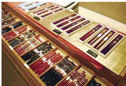
請輸入圖片文字介紹或敘述。

【氣比松原】日本三大松原之一全長約1.5公里、寬約40萬平方米的廣闊腹地有白松青松・赤松,黑松約有17,000多棵。與三保松原、虹之松原、並稱為日本三大松原,夏天也是著名海水浴場。【杉樹林隧道】約500株杉樹齊栽在全長2.4公里長的道路兩旁的兩側,樹高約30米與筆直的馬路相連非常美麗。圓杉是柏樹科的植物,因著季節形成獨特景色近年來成為賞楓紅排行人氣王。夏天有長綠。秋天時有黃轉橘紅。冬天時被雪覆蓋的雪白。【箸の体験】著名的若狹塗り箸,來到若狹讓我們體驗製作一副專屬自己的筷子。