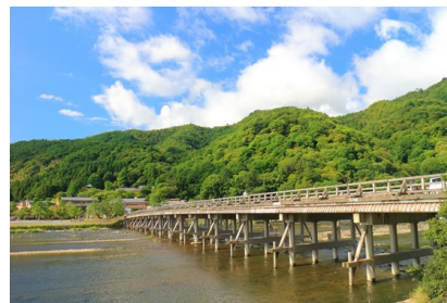
京都必遊勝地 嵐山渡月橋