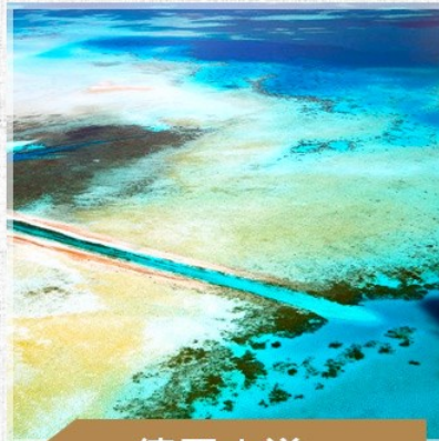
德國水道 german channel