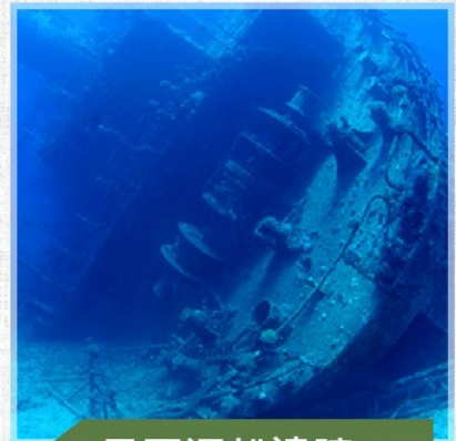
日軍沉船遺蹟 Helmet wreck