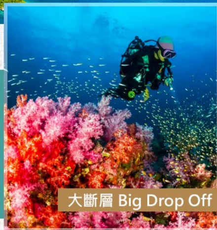
大斷層 Big Drop Off

大斷層被全球潛水界人士譽為世界七大潛點之首。在這裡，除了可以看到斷層區之外，還可以看到大型的洄游魚群，如拿破崙魚、扳機豚、黃金蝴蝶魚等非常豐富的魚類。