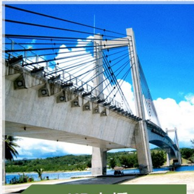
KB大橋 Palau KB Bridge

又稱銀河水道，是洛克群島中的一個山中湖，因數千年前火山爆發噴發出的火山灰，因長年累月的沉積所形成的特殊地形，因湖水呈乳白色狀似牛奶，故稱牛奶湖，將此區從湖底撈上來之火山泥塗抹在身上有美白之功效。