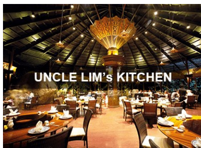
UNCLE LIM'S KITCHEN