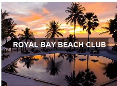
ROYAL BAY BEACH CLUB