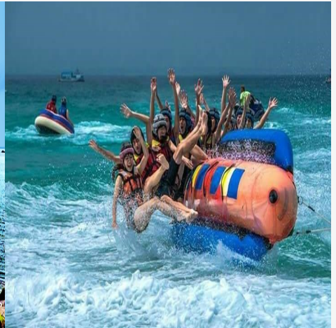
吉貝水上活動~每人700元