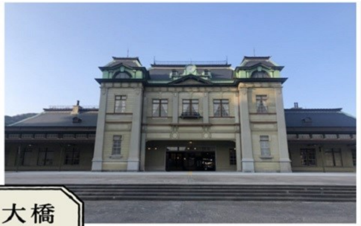
關門大橋 門司港散策