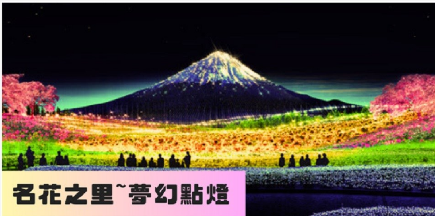
名花之里~夢幻點燈