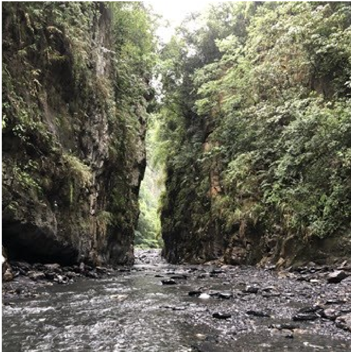
鳥居 torii 喫茶食堂