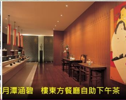
日月潭涵碧樓東方餐廳自助下午茶