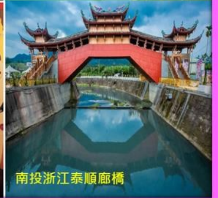
南投浙江泰順廊橋