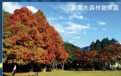
奧萬大森林遊樂區