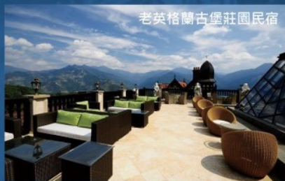
老英格蘭古堡莊園民宿