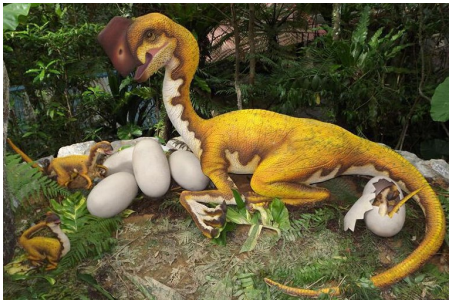
在這日本唯一的筆筒樹原生林裡，您絕對想不到，這片森林裡竟然住了52隻恐龍!!! 有身長8公尺的暴龍、最兇猛的劍龍、還有你說得出說不出的各珍貴品種恐龍都在這裡