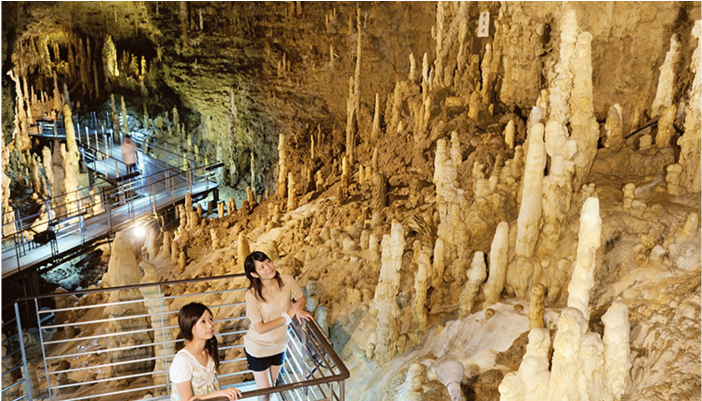
【玉泉洞】為全日本最大，擁有超過100萬支鐘乳石，許多鐘乳石都有千百前的歷史，遊客可欣賞各式各樣奇形怪狀的鐘乳石，有的旁邊還立有牌子，上面寫著它們的名字哦！