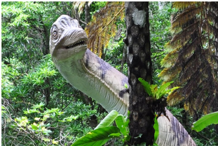
位於元祖紅芋菓子名護店的「山原亞熱帶之森」，於2016年5月重新開幕。