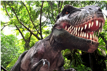
山原之森·亞熱帶恐龍主題森林公園