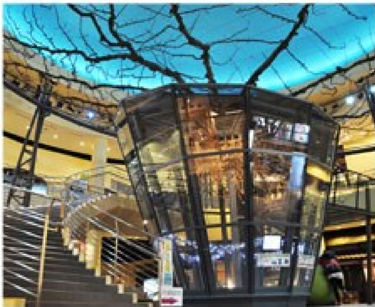
二十世紀梨博物館