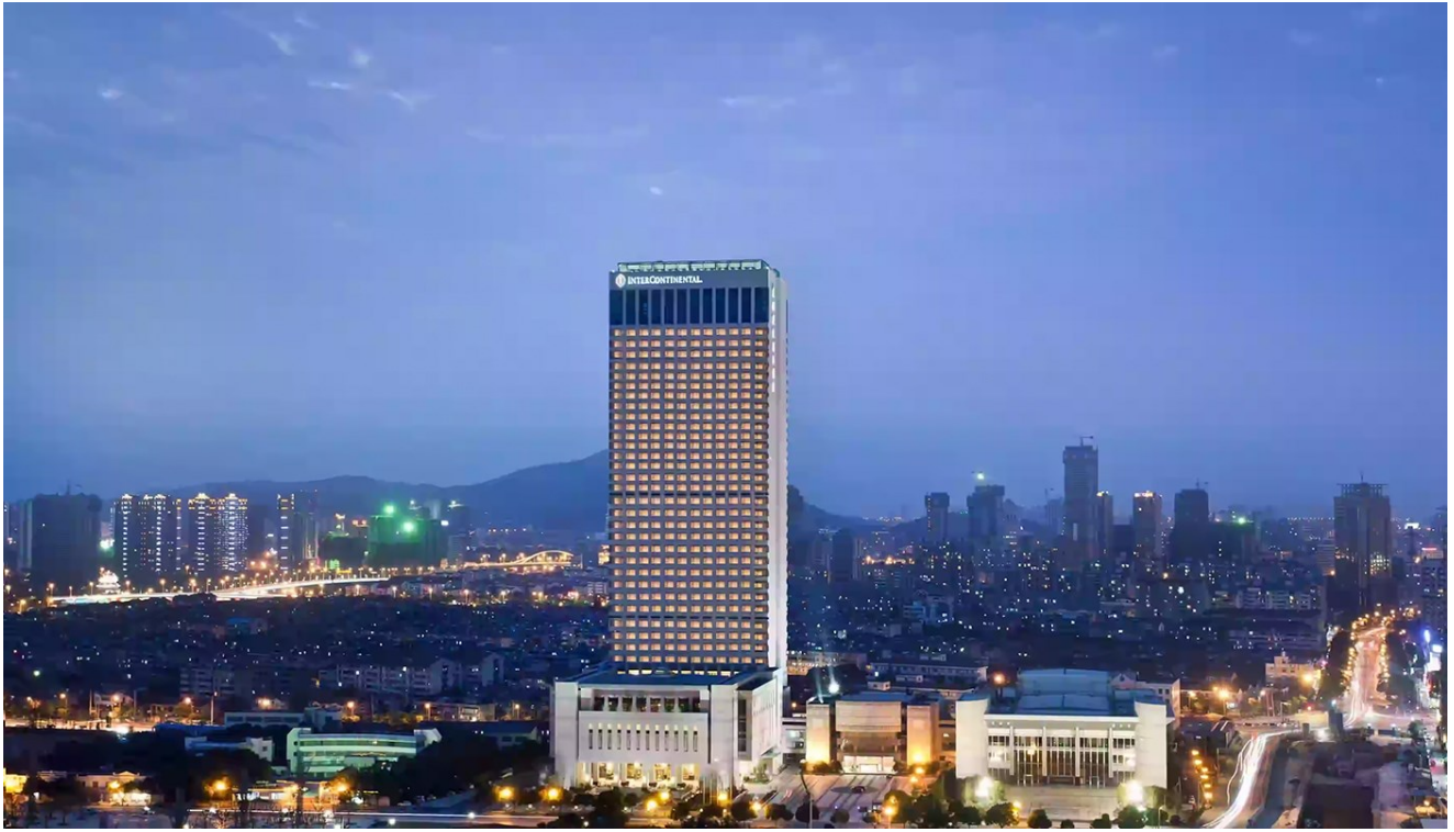
無錫君來洲際酒店