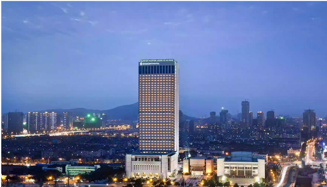
無錫君來洲際酒店