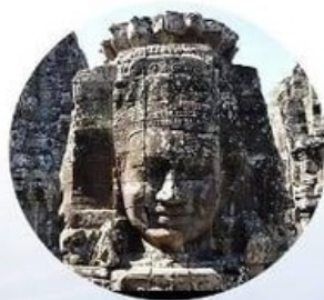
↑聞名世界的「高棉的微笑」

由四十九座大大小小寶塔構成一座大寶塔，其中最特殊的設計，是每一座塔的四面都刻有三公尺高的加亞華曼七世的微笑面容，兩百多個微笑浮現在蔥綠的森林中，多變的光線或正或側，時強時弱地探照，樹草中的蟲鳥此起彼落的交織輪唱，好似一個設計新穎的聲光舞台秀，軒昂的眉宇、中穩的鼻樑、熱情的厚唇、慈善的氣質，國王的微笑反而勝過建築本身的宏偉，而成為旅客最深的印象，佛像慈祥開目，曉帶微笑，《高棉的微笑》一語就是從此而來。