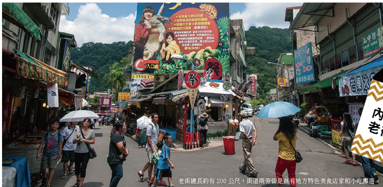
老街總長約有 200 公尺，街道兩旁皆是具有地方特色美食店家和小吃攤商。