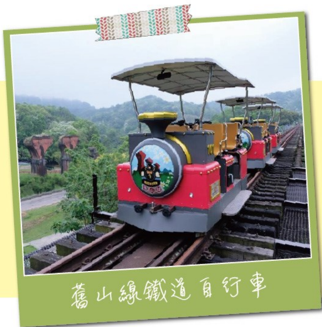
舊山線鐵道自行車

有鑑於地方對於舊山線軌道活化再利用有著殷殷期盼，因此縣府參考挪威、德國、韓國等國模式，提出符合世界閒置鐵道活化再利用趨勢的「Railbike軌道自行車計畫」，以動態文化保存的方式，讓遊客能以低碳、環保、健康的方式體驗舊山線之美