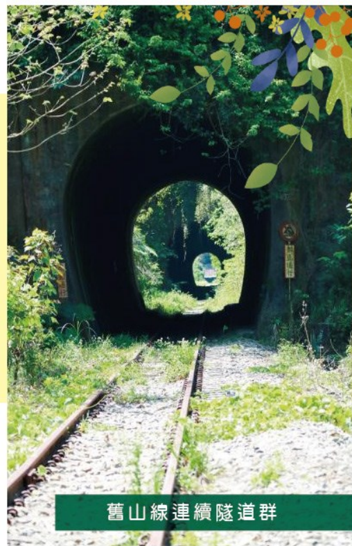
舊山線連續隧道群

有鑑於地方對於舊山線軌道活化再利用有著殷殷期盼，因此縣府參考挪威、德國、韓國等國模式，提出符合世界閒置鐵道活化再利用趨勢的「Railbike軌道自行車計畫」，以動態文化保存的方式，讓遊客能以低碳、環保、健康的方式體驗舊山線之美