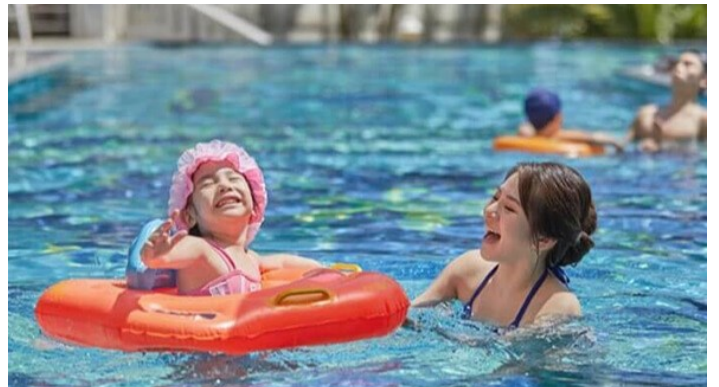
陪伴家人的歡樂時光

朝迎太平洋晨曦日出，夜賞花蓮萬家燈火，乃台灣島上地理位置最獨特、視野景觀最佳的五星飯店。