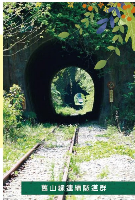
舊山線連續隧道群

有鑑於地方對於舊山線軌道活化再利用有著殷殷期盼，因此縣府參考挪威、德國、韓國等國模式，提出符合世界閒置鐵道活化再利用趨勢的「Railbike軌道自行車計畫」，以動態文化保存的方式，讓遊客能以低碳、環保、健康的方式體驗舊山線之美