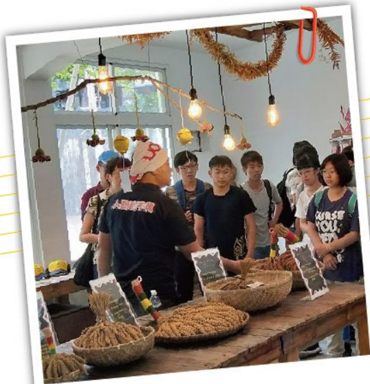
小米學堂+DIY 學習小米文化