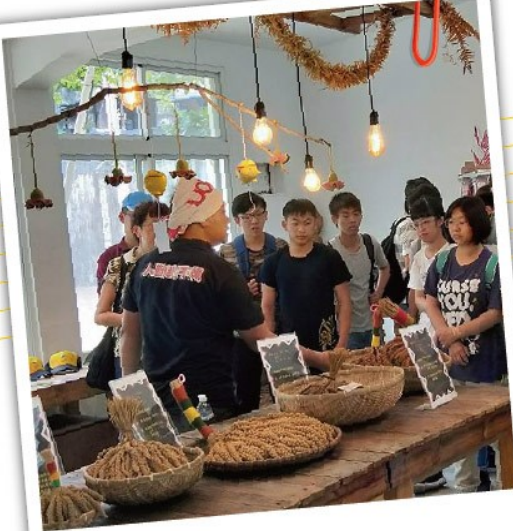
小米學堂+DIY 學習小米文化