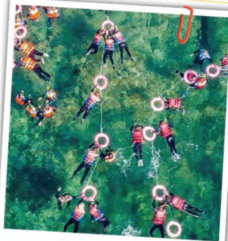
海洋尋寶記-浮潛 難忘的體驗