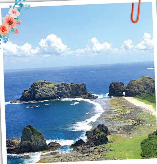
綠島深度環島 綠島七大主題