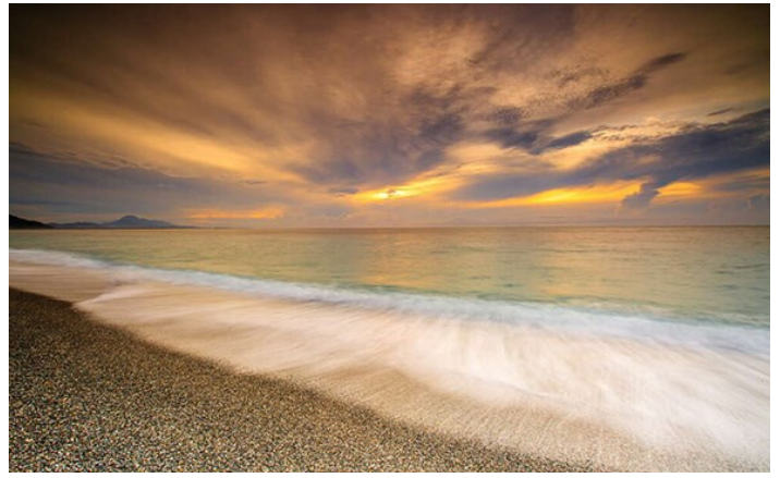
千禧曙光紀念公園

引許多追星族及遊客前往拍照留念。因伯朗大道平時為產業道路，供農民們務農時使用，前往造訪時請注意，不要任意踐踏農田及擋住務農車輛。