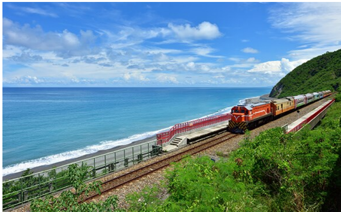
全台最美火車站-多良車站

此段公路樟樹與木麻黃密林成蔭，兩旁小葉欖仁樹林立，景色宜人的綠色隧道，保持自然風味且極具生態意義。優遊於迷人的綠色公路並享受森林芬多精最多的樟樹，夾雜一些木麻黃與小葉欖仁，看著陽光穿透樹葉，看著小葉欖仁樹的樹形，閉起眼睛，體驗與都市不同步調，盡情放鬆身心與大自然結合。