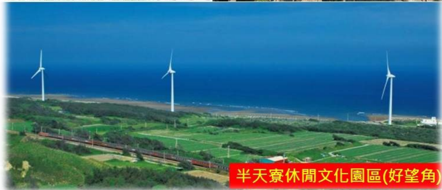
半天寮休閒文化園區(好望角)