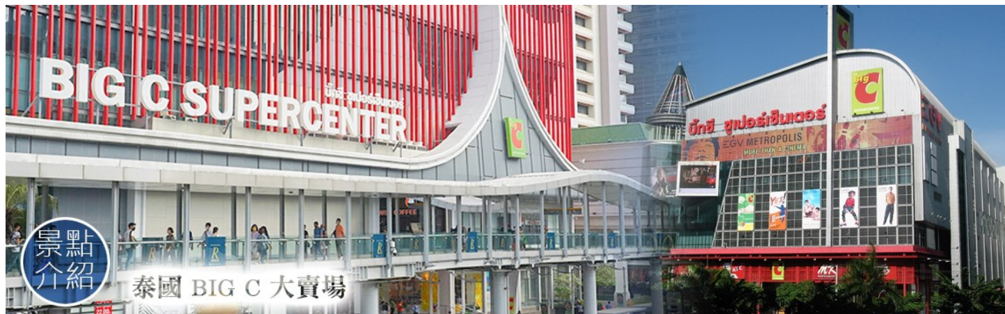
泰國 BIG C 大賣場