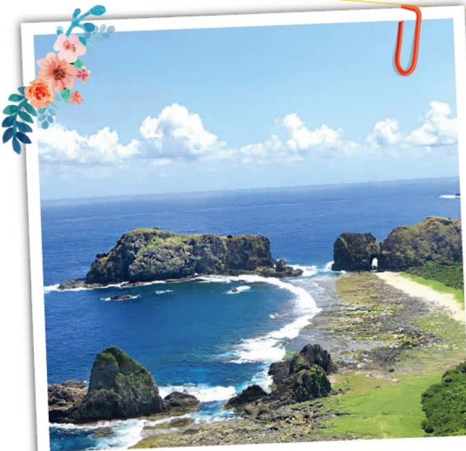
綠島深度環島 綠島七大主題