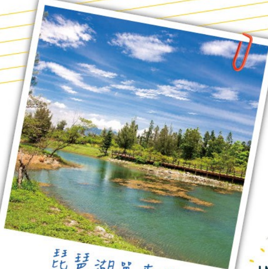
琵琶湖單車遊 旅人來這裡必拍照的景點