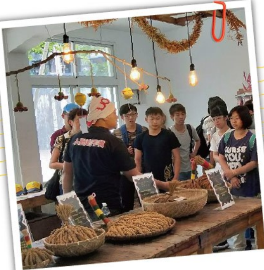
小米學堂+DIY 學習小米文化